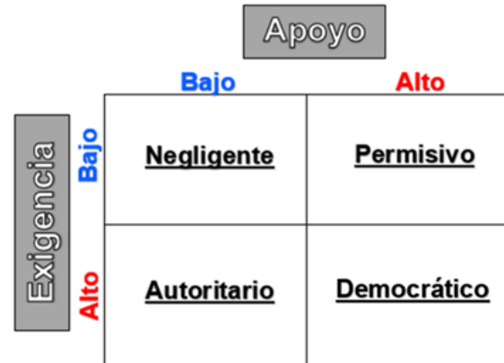
Gráfico 1. Estilos de crianza

1991) y un equilibrio claro de capacidad de respuesta y exigencia.