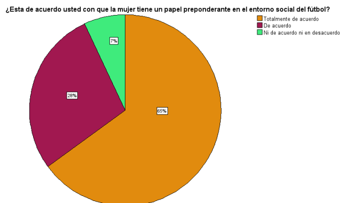
Gráfico 2 Panel de la mujer en el fútbol

y 6 no están ni de acuerdo ni en desacuerdo.