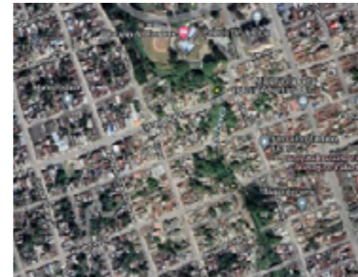
Figura 1. Mapa satelital donde se observa una parte del Consejo Popular Condado Sur y el río Bélico. Los puntos amarillos indican las dos zonas de colectas de C. gariepinus , Foto Google Maps.

La investigación se llevó a cabo en dos zonas del ecosistema dulceacuícola Bélico (Figura 1) en la ciudad de Santa Clara, Villa Clara, Cuba (Figura 2).