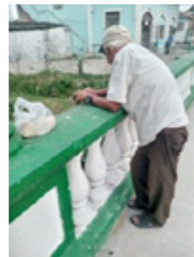
Figura 4. Foto tomada a un pescador furtivo en plena faena de pesca de C. gariepinus

Los autores de esta investigación pudieron constatar in situ, mediante la observación los procesos de pesca de C. gariepinus en el ecosistema dulceacuícola Bécico (Figura 4), la preparación de los filetes de Claria y su venta a pobladores del Consejo Popular Condado Sur, que esperaban en una fila la llegada de los pescadores con su carga.