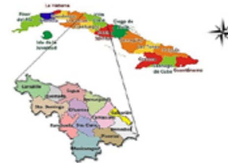
Figura 2. Mapa de Cuba con sus 15 provincias y el municipio especial Isla de la Juventud y mapa de la provincia de Villa Clara con sus municipios.

Este río nace en la loma Dos Hermanas a los 22.387° de latitud norte y los 79.965° de longitud oeste, su vertiente o desembocadura se consume en el río Arroyo Grande ubicado a los 22.465° de latitud norte y los 70.966° de longitud oeste en la ciudad de Santa Clara. Es de destacarse que las aguas que corren a través del cauce se caracterizan por su baja calidad a causa de la fuerte contaminación de que es objeto por la deposición inadecuada de los residuos sólidos y las características de los vertederos así como los residuos líquidos, al verterse las aguas negras sean urbanas e industriales y de los centros de salud que vierten hacia sus aguas de forma directa mediante conexiones legales e ilegales que ocasionan cambios en la calidad de sus aguas (Hernández, 2018)