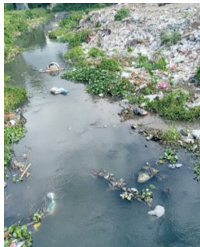
Figura 3. Foto de una zona del río Bélico donde se realizaron las capturas de C. gariepinus (obsérvese la cantidad de desechos que posee esta fuente dulceacuícola)

debido a su toxicidad, bioacumulación, larga persistencia y biomagnificación en la cadena alimentaria, lo que no difiere de lo expresado por (Erdoğan & Ates 2006; Agah et al., 2009; Yi & Zhang, 2012; Monroy et al., 2014). La figura 3 muestra una zona del río Bélico altamente contaminada donde se realizaron las capturas de C. gariepinus