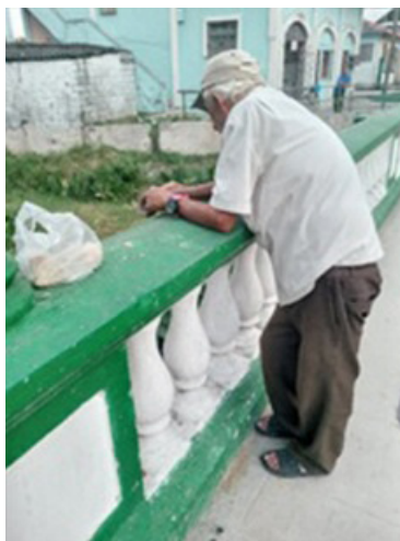
Figura 4. Foto tomada a un pescador furtivo en plena faena de pesca de C. gariepinus Foto: Rafael Armiñana García.

Los autores de esta investigación pudieron constatar in situ, mediante la observación los procesos de pesca de C. gariepinus en el ecosistema dulceacuícola Bélico (Figura 4), la preparación de los filetes de Claria y su venta a pobladores del Consejo Popular Condado Sur, que esperaban en una fila la llegada de los pescadores con su carga.