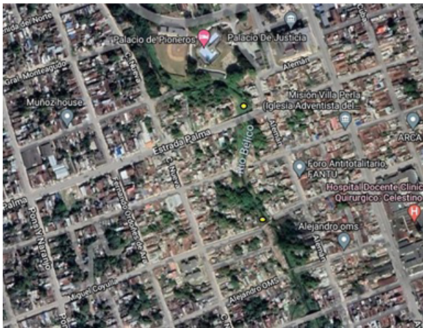
Figura 1. Mapa satelital donde se observa una parte del Consejo Popular Condado Sur y el río Bético. Los puntos amarillos indican las dos zonas de colectas de C. gariepinus , Foto Google Maps.

La investigación se llevó a cabo en dos zonas del ecosistema dulceacuícola Bético (Figura 1) en la ciudad de Santa Clara, Villa Clara, Cuba (Figura 2).